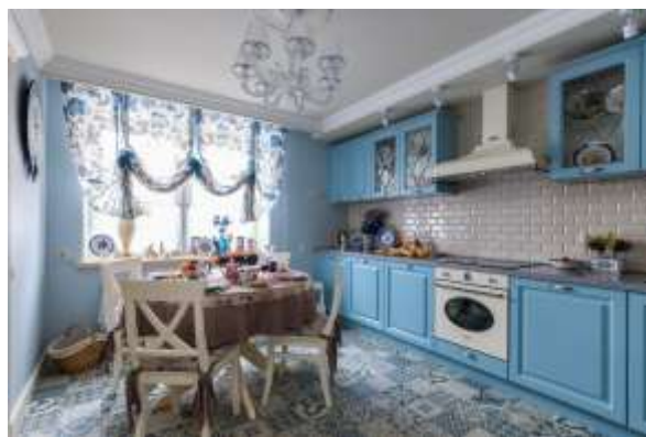
Рис.4. Пример кухонного гарнитура стиля «Прованс»

Подрисуночную подпись оформляют кеглем пониженным без абзацного отступа и без точки в конце. Если наименование рисунка состоит из двух предложений, то после первого предложения ставится точка, а окончание надписи располагается по центру и точка в конце не ставится. Допускается оформление подрисуночной надписи курсивом или жирным начертанием. Длина строки подрисуночной подписи должна быть не больше ширины рисунка. Сокращение « рис. » используется только при наличии у рисунка цифры-номера, после точки название рисунка должно начинаться с прописной буквы. Слово « Рис. » можно оформить курсивным или жирным начертанием. В этом случае в тексте обязательно должна присутствовать ссылка на рисунок, например (рис.4):